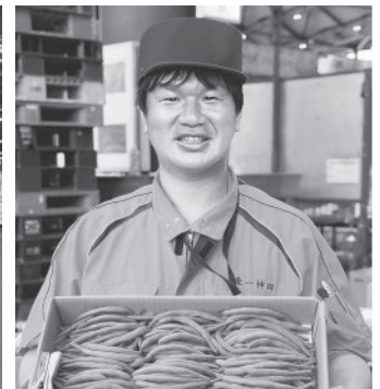
東一神田青果株式会社