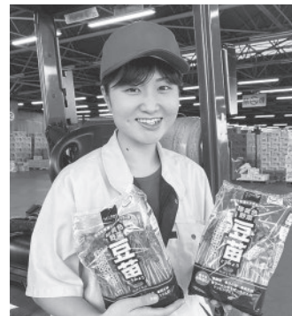
東一宇都宮青果株式会社