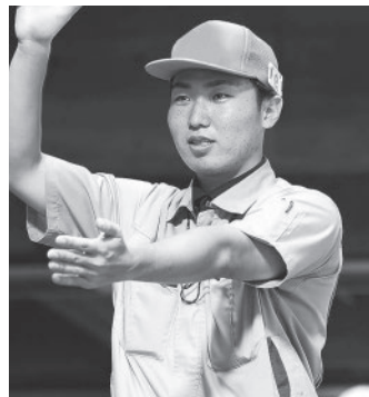
東一川崎中央青果株式会社