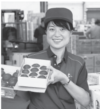
東京青果株式会社