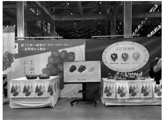
トップセールス会場

「クイーンルージュ®」の特徴などをPRした。また、種なしで皮ごと食べられるブドウとして、「クイーンルージュ®」とともに「ナガノパープル」、「シャインマスカット」も合わせて、長野県「ぶどう三姉妹®」をPRした。トップセールスの会場では、「ぶどう三姉妹®」のイメージキャラクターのパネル展示やPR動画の放映、「クイーンルージュ®」、「ナガノパープル」、「シャインマスカット」のサンプル配布を行った。流通関係者の注目度は非常に高く、「クイーンルージュ®」および「ぶどう三姉妹®」を十分にPRできたトップセールスとなった。今後も、「クイーンルージュ®」並びに「ぶどう三姉妹®」をPRするため、店頭での宣伝販売をはじめ様々な販売促進活動を実施していきたい。